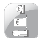
3 WAY PAY