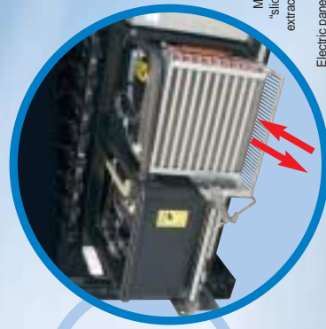
Mono-block cooling unit "slide-in/inside-out" for easy extraction.