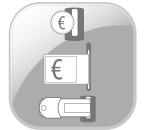
3 WAY PAY