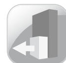
EASY SLIDE OUT