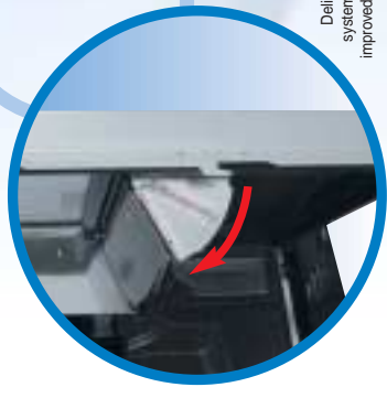
Delivery bin system patented for improved anti intrusion.