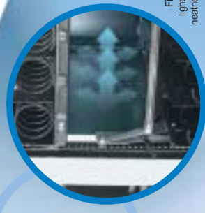
Patented ventilation. Filled lateral neon ceiling light covers the wiring for neatness and safety.