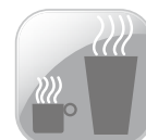
TTT TWIN TASTE TECH